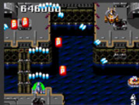
WAVE3 TERRA DIVER 海上基地