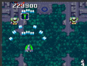
WAVE2 LAST MESSIAH 森林都市