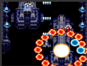
WAVE1 HACKING STORM 宇宙戦闘