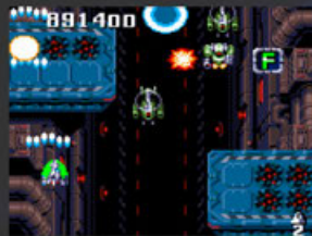
WAVE4 PERFECT RAGE 兵器工場